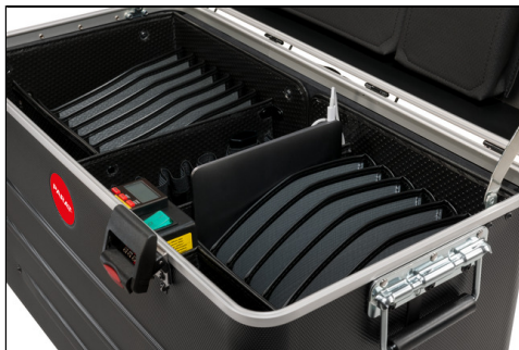
- Staufächer aus HTP