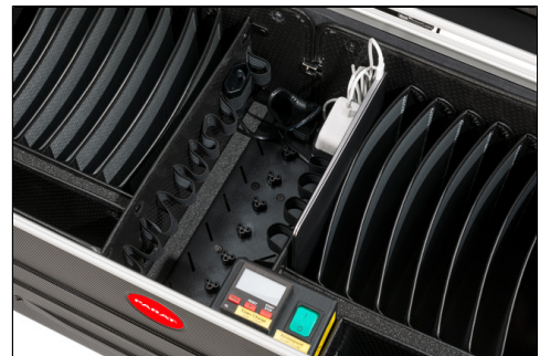
- zentrale Stromversorgung mit Schutzkappe